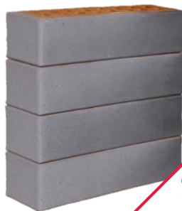
серый с серебром Харстад