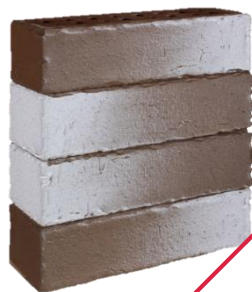
коричневый с белым Нарвик